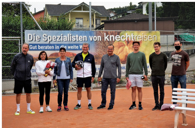
Unsere Clubmeister- und finalisten 2021

Weitere Fotos gibt es auf unserer Homepage https://www.tc-muhen.ch/fotogalerie/clubmeisterschaften-gv/